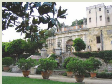
Vista del Castello dal parco delle delizie.