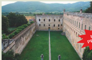
Il cortile dei Giganti.

Le modalità del concorso sono disponibili presso il sito www.castellodelcatajo.it .