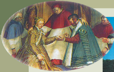
Papa Innocenzo IV Fieschi sposa Luigi Obizzi con la nipote Caterina Fieschi (particolare).

Castello del Catajo - Via Catajo, 1 - 35041 Battaglia Terme (PD)