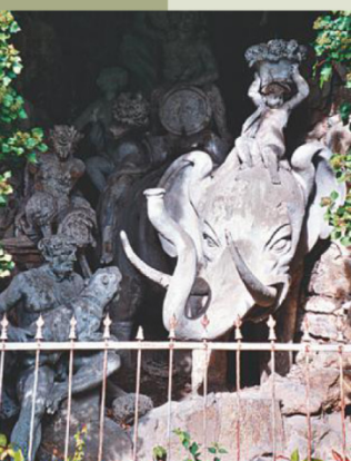
La fontana dell'elefante.